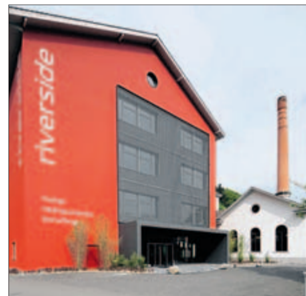
Von aussen präsentiert sich der Hotelbau in Rot.