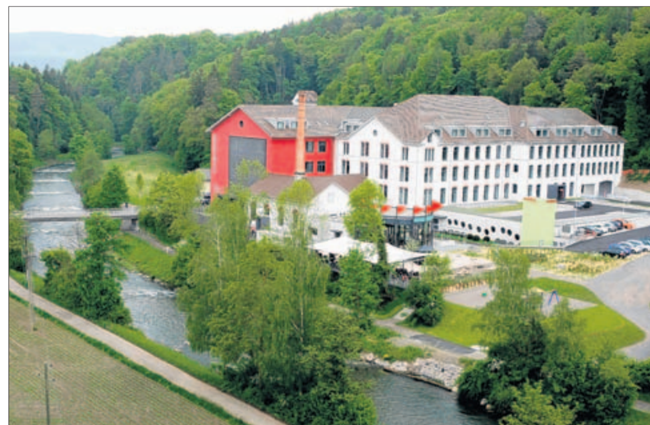
Zwischen der Glatt und dem Glattfelder Wald liegt das Riverside idyllisch eingebettet.

Riverside: Weitere Informationen im Internet unter www.riverside.ch oder unter der Linkseite auf www.zuonline.ch .