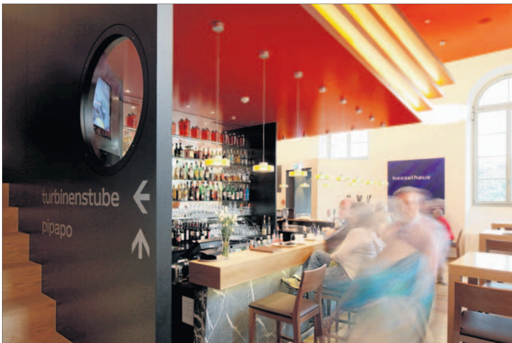
Im Kesselhaus genehmigen sich die Gäste einen Drink oder suchen sich auf der Speisekarte ein schweizerisch-bürgerliches Gericht aus.