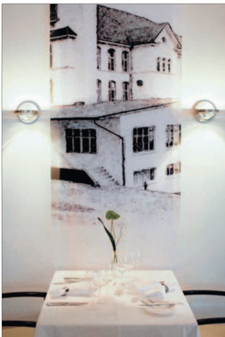
Alte Zeichnungen erinnern in der Turbinenstube an die früheren Zeiten.